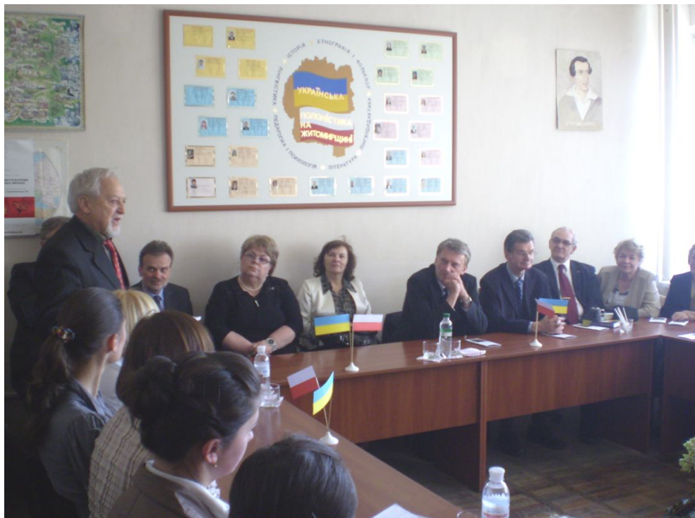
Фото № 17 Делегация ученых из Польши в Центре полонистики. Выступает профессор Януш Гайда.