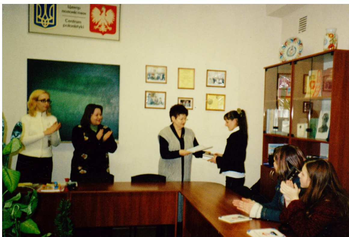
Фото № 14 В Центре полонистики. Награждение победителей олимпиады по польскому языку.