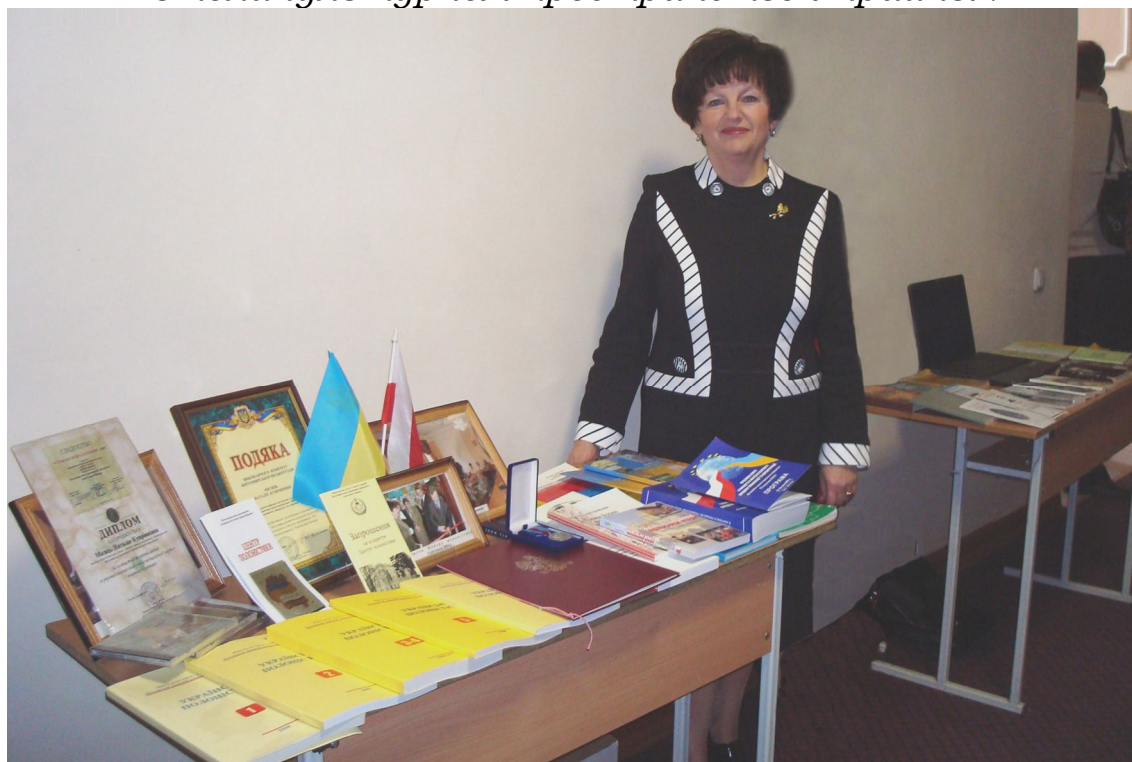
Фото № 16 Материалы Центра полонистики на выставке.