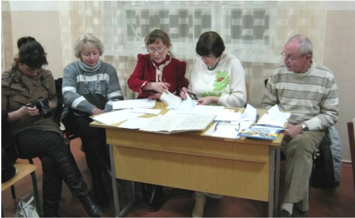
Фото № 23 Работает жюри на конкурсе «Знатоки языков».