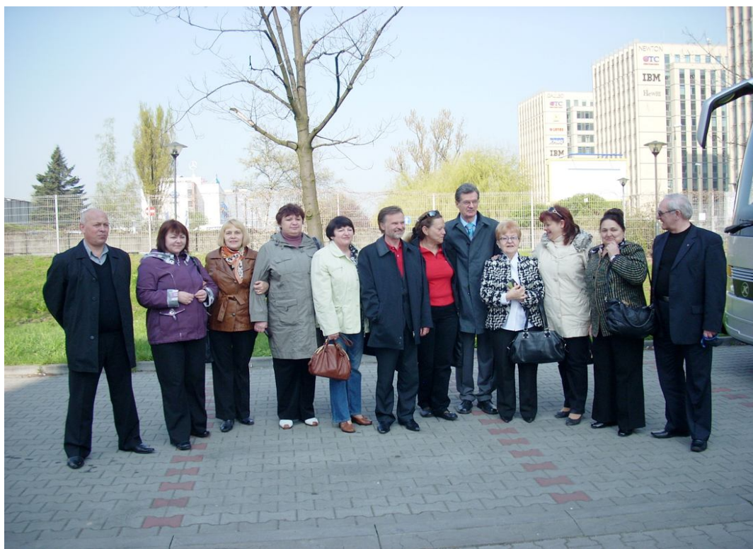
Фото № 32 Украинская делегация на научной конференции в Кракове (2010 г.).